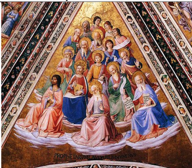
Cristo profeta, e più che profeta

G li Ebrei vivevano apparentemente una storia profana simile in tutto alla storia degli altri popoli. Il profeta invece legge la storia come un dialogo drammatico tra Dio e l'uomo, e così la trasforma in una storia «sacra». Il profeta legge sempre il presente con uno sguardo retrospettivo (alleanza del Sinai) e uno sguardo prospettico (nuova alleanza). Perennemente insoddisfatto del presente, egli fa camminare la storia e la spinge verso il compimento: l'alleanza, la comunione d'amore dell'umanità con Dio. Ma quando il compimento giunge, si realizza in modo del tutto inatteso: l'alleanza è Gesù di Nazaret, Uomo-Dio. Una unione dell'uomo con Dio più perfetta è impossibile. Egli non solo parla a nome di Dio ma è Dio che parla in lui. E' rivelazione perfetta. In lui coincidono la profezia e l'oggetto della profezia. Per questo Gesù è profeta, e insieme più che profeta (vangelo).