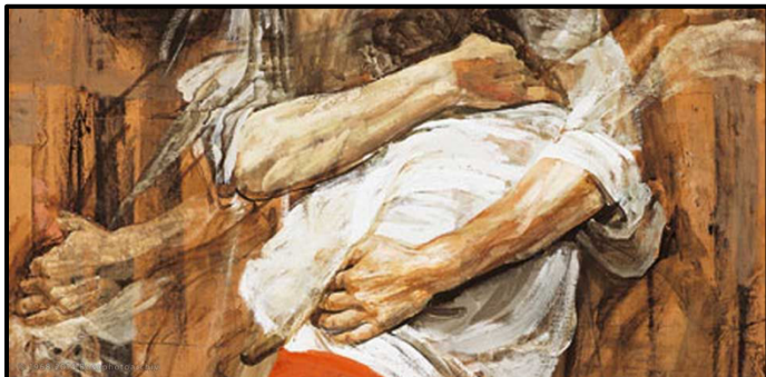
Safet Zec, Abbraccio , tempera su carta, 1995.